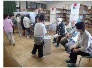
▲ 蹠小学校 模擬投票