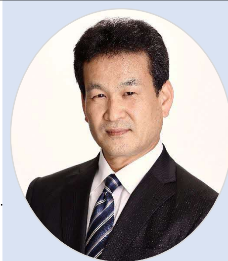
しんぼう じろう 辛坊 治郎 さん

令和6年11月22日(金) 午後2時00分 枚方市総合文化芸術センター本館(関西医大 大ホール) 先着780名 入場無料