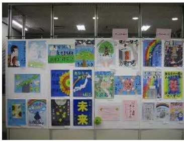
▲ 枚方市が選んだ入選作品展 (枚方市役所別館 玄関ホール)

枚方市の入選作品は、1月中旬に市役所別館玄関ホールで展示し、枚方市選挙管理委員会のホームページに作品ギャラリーを設けて紹介しています。