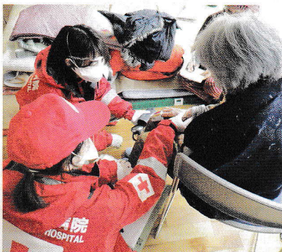
能登半島地震において避難所にて被災者のケアを行う救護班