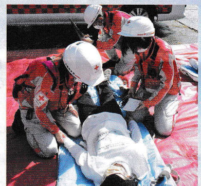
堺市立総合医療センターでの訓練