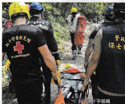
台湾東部沖地震において渓谷で閉じ込められた人びとの救護活動に向かう台湾赤十字組織の災害対応チーム