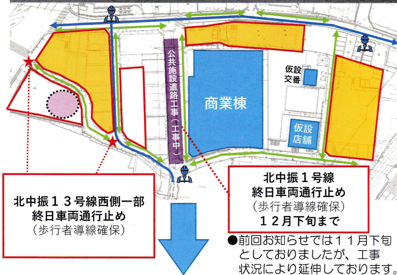
ステップ② 令和6年1月上旬～令和6年5月下旬