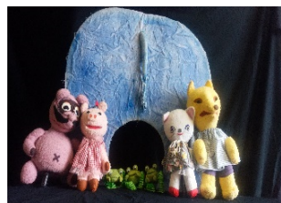
うたとおともだち