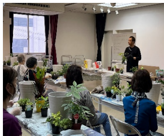
写真は講座の様子

7月1日に初夏の寄せ植え講座が実施されました。パキラやセロームの他、アイビー等の観葉植物を使った豪華な寄せ植えに、ご参加の皆さまは大満足のご様子でした。