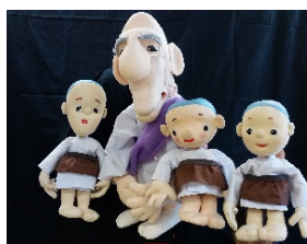
おしょうさんとこぞうさん