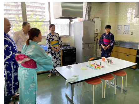
★写真は、今年7月の縁日・浴衣体験のご様子