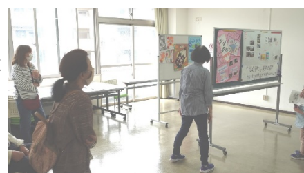
★写真は、5月の若葉まつりのご様子。