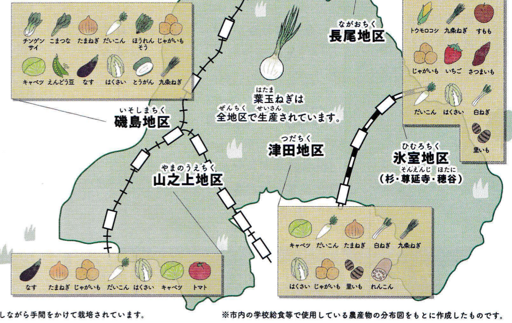
※市内の学校給食等で使用している農産物の分布図をもとに作成したものです。