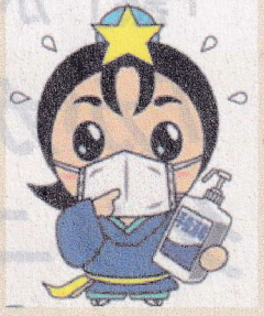
枚方市キャラクター「ひこぼしくん」